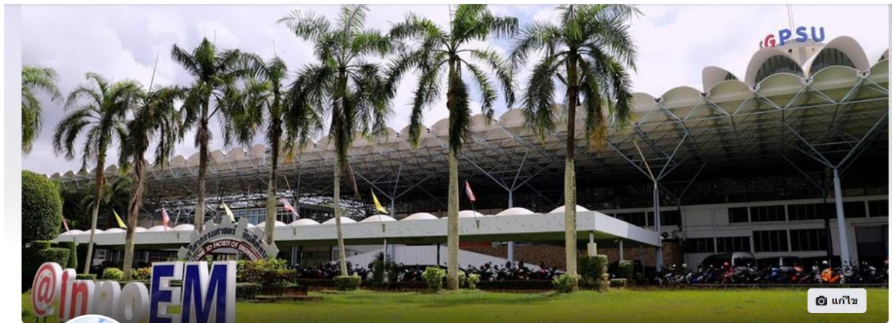
งานทะเบียน คณะวิศวกรรมศาสตร์ ม.อ.