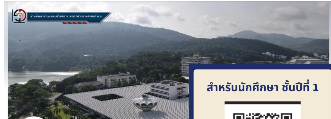
งานพัฒนาทักษะและสวัสดิการ คณะวิศวกรรมศาสตร์ ม.อ.